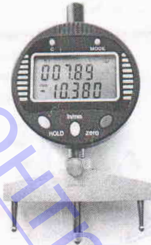
Рисунок А.1 – Радиусомер индикаторный цифровой РИЦ-5-1000-0,01